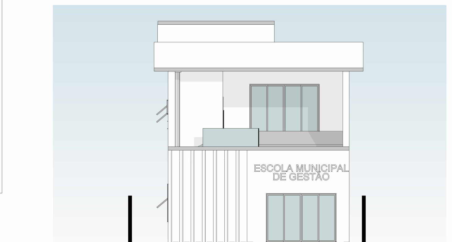
CORTE A ESC: 1:100