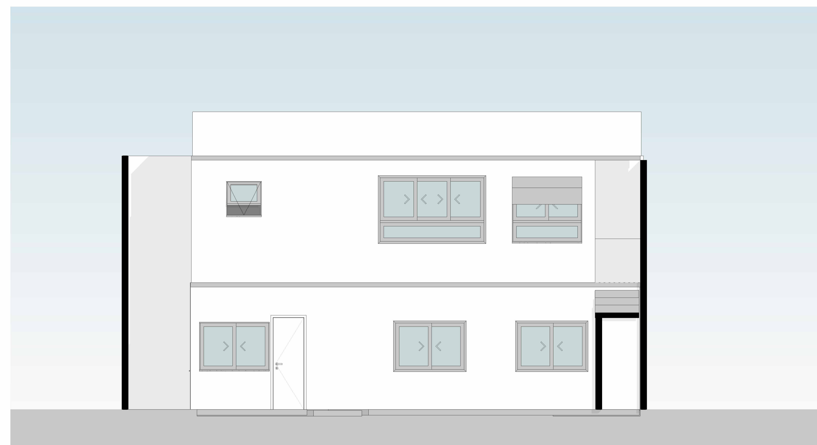
FACHADA FUNDOS ESC: 1:50