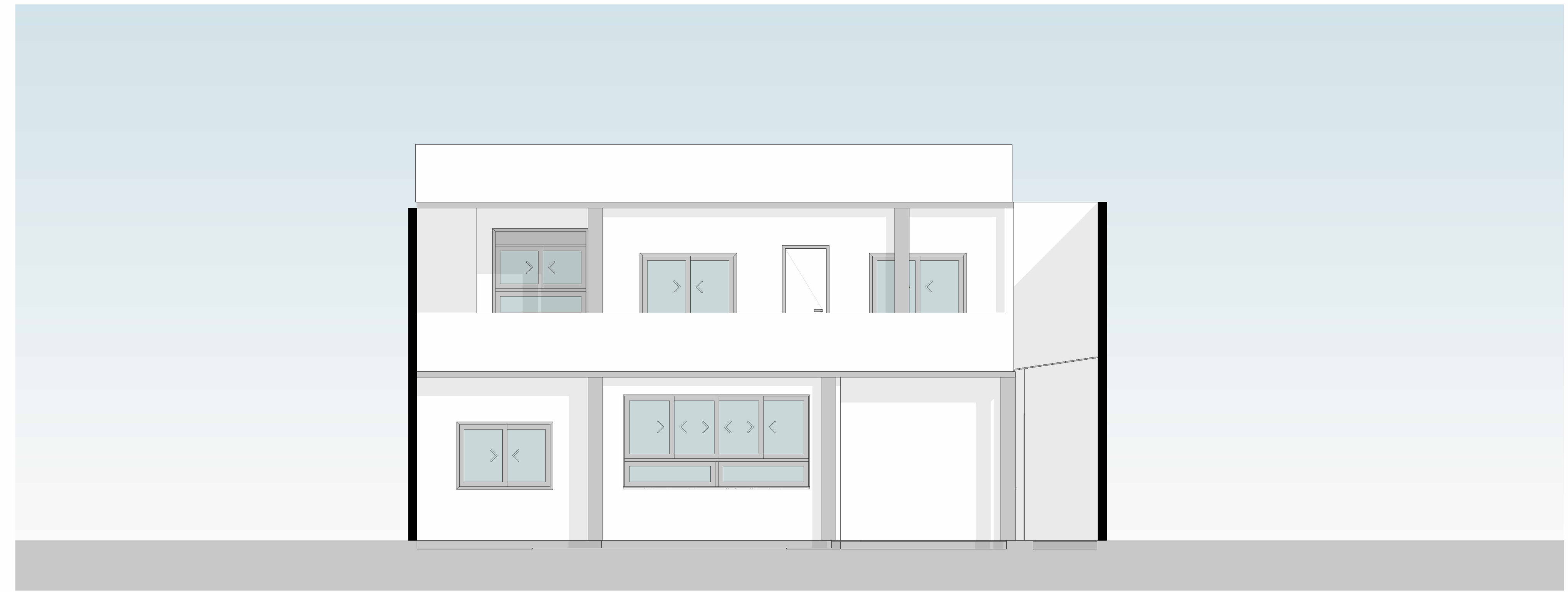
FACHADA FRONTAL ESC: 1:50